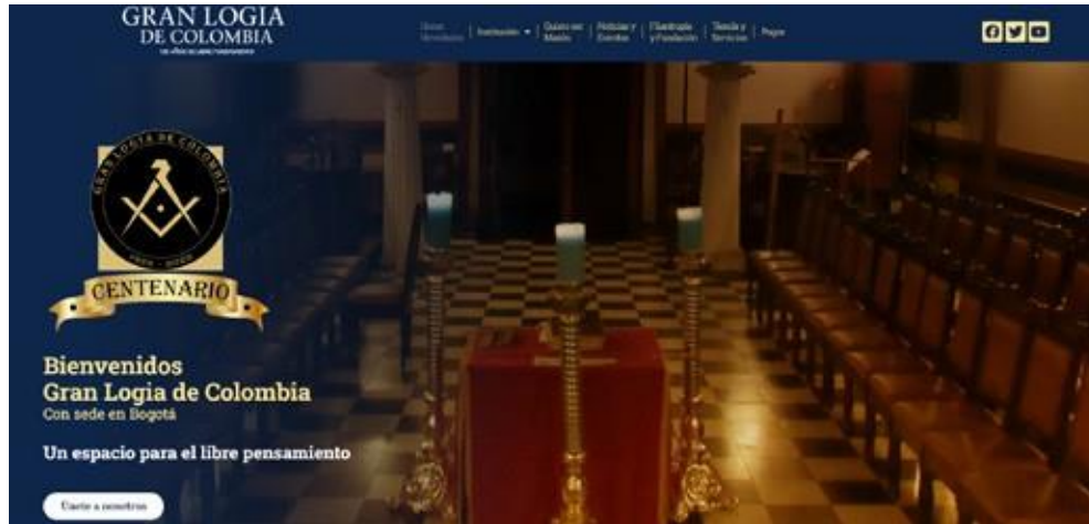
Imagen principal página web Gran Logia de Colombia, Tomado de www.granlogiadecolombia.org

Desarrollo de la página web institucional de la Gran Logia de Colombia www.granlogiadecolombia.org tomando como referencia la página web de la Gran Logia unida de Inglaterra.