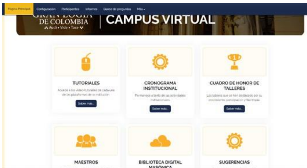
Imagen principal página web Gran Logia de Colombia, Tomado de https://granlogiadecolombia.org/learning/

Desarrollo de la herramienta web "Campus virtual", un espacio virtual para la formación masónica, proyecto de educación en formulación por el ICIM.