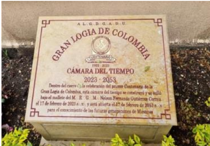
Cámara del Tiempo